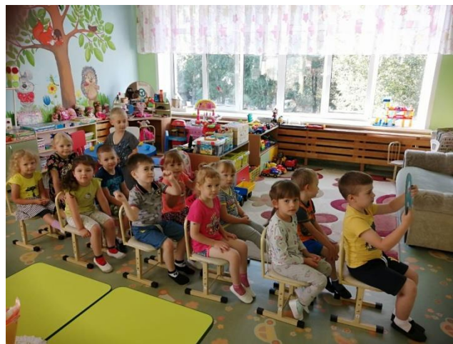
Сюжетно- ролевая игра «Автобус»