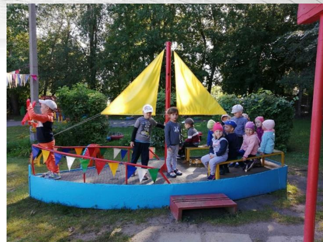
Сюжетно- ролевая игра «Путешествие на теплоходе»