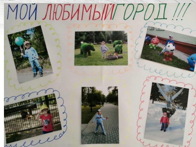
Фотовыставка «Мой любимый город»