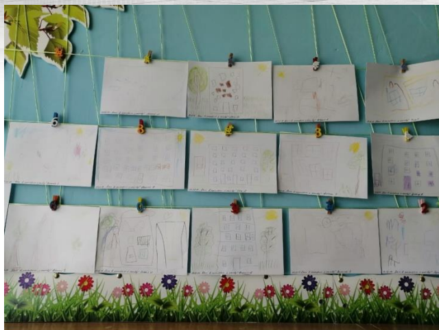
Рисование «Мой дом»