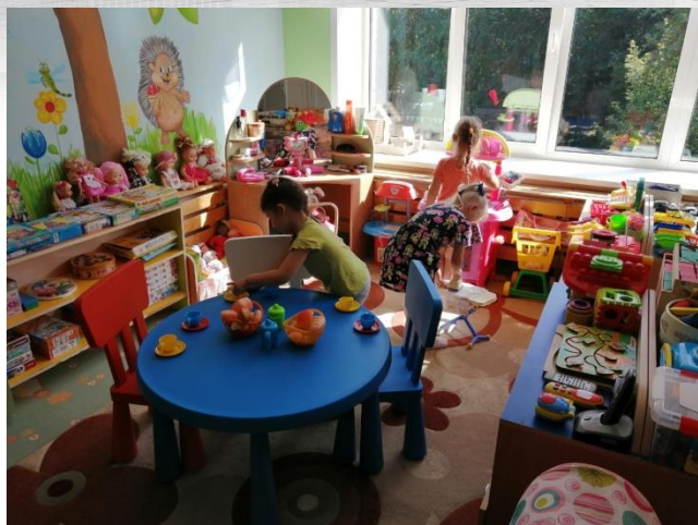
Сюжетно- ролевая игра «Семья»