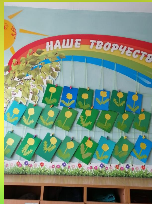
Аппликация «Носит одуванчик желтый сарафанчик»