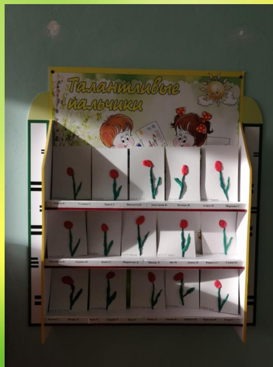
Лепка «Выросли цветы небывалой красоты»