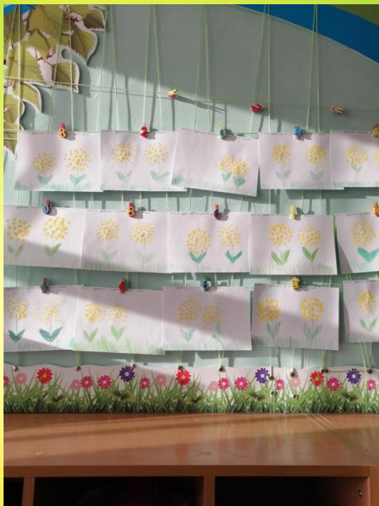
Рисование «Одуванчики на зеленой лужайке»