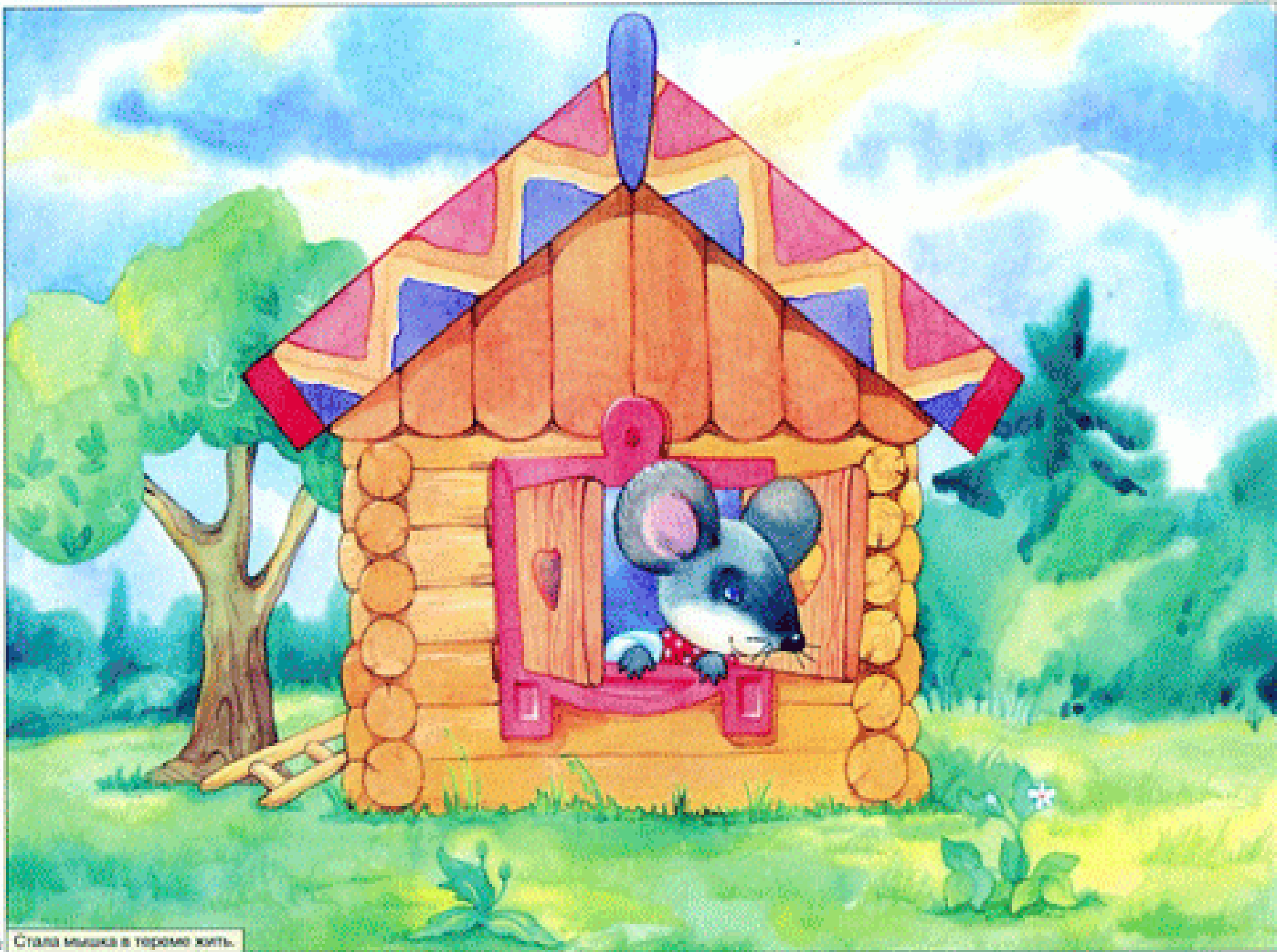
Стала мишка в торомо жить.