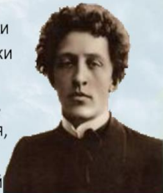
Александр Александрович Блок

В Воскресенье Вербное Завтра встану первая Для святого дня