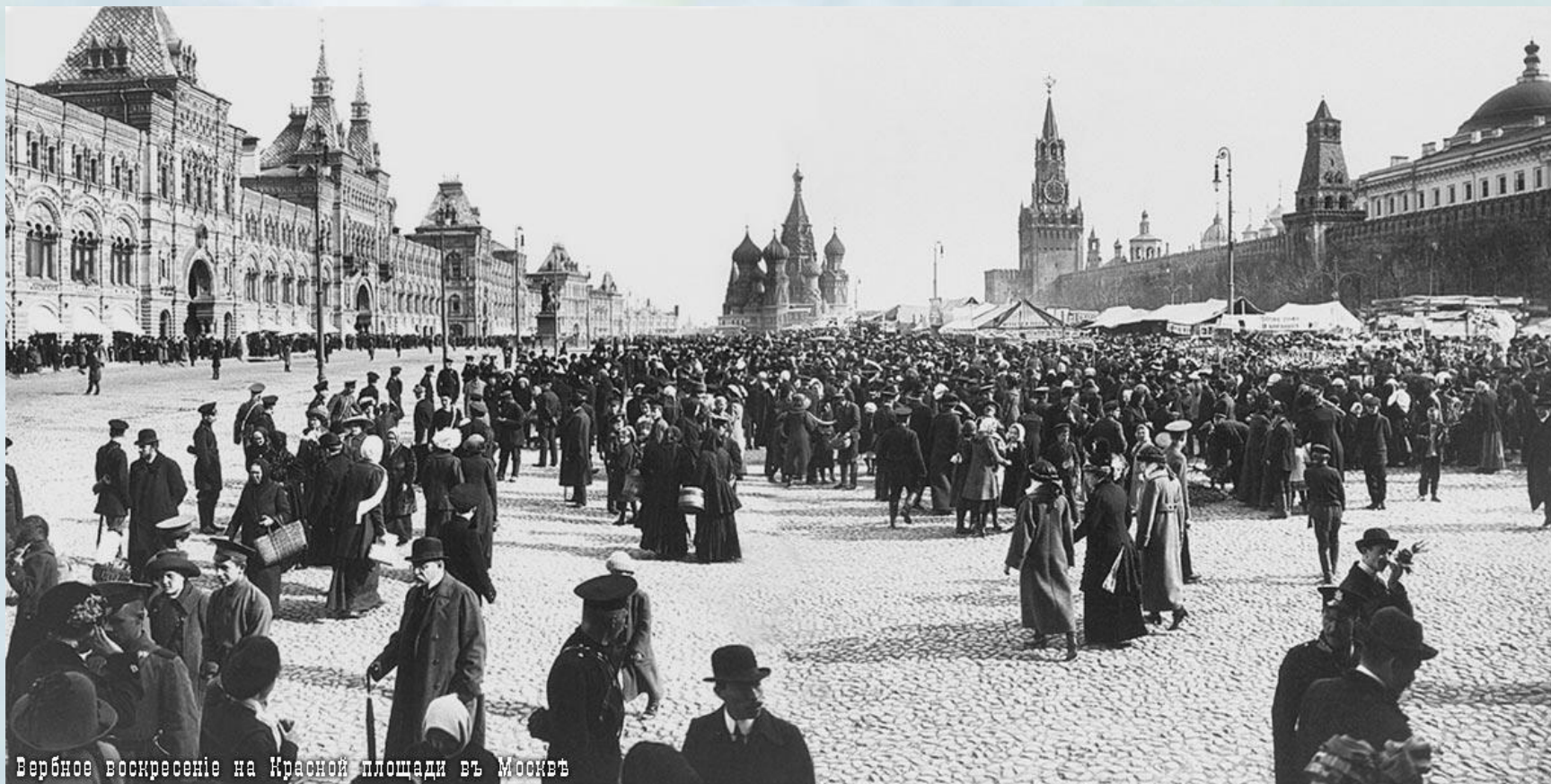
Вербное воскресенье на Красной площади в Москве

В Вербное воскресенье устраивались вербные базары, на которых можно было купить сладости, игрушки, книги, а также веточки вербы с привязанными к ним бумажными ангелочками.